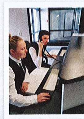
Mise en place d'un accueil en chambre sur le thème de la Saint Valentin