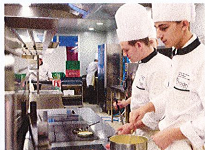
Production en cuisine par des élèves de STHR