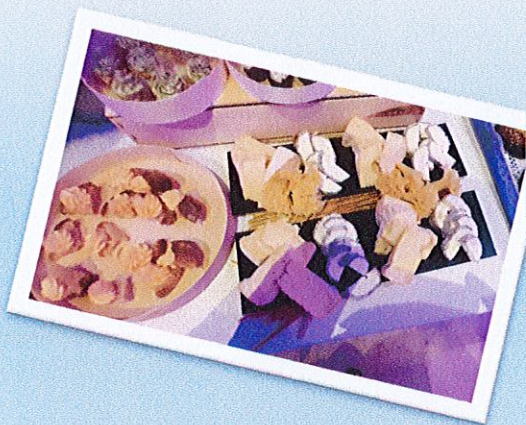
Buffet de fromages réalisé par les élèves

L'industrie hôtelière est en recherche constante d'agents de maîtrise et de cadres. Le nombre d'emplois dans le secteur de l'hébergement et de la restauration a fortement progressé (hausse de plus de 25%).